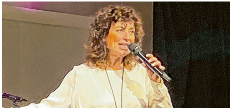
Ein bisschen wie eine Prinzessin fühlte sich Isabelle Varell im Wittelsbacher Schloss in Friedberg.

Inhaltlich dreht sich vieles um das Älterwerden – allerdings ohne Resignation. „60 plus – da geht noch was“, sagt sie. Sie berichtet von ihrem späten Einstieg ins Laufen, von inzwischen acht Marathons und davon, dass Bewegung für sie mehr ist als nur Sport: „Laufen als Lebenshilfe.“ Die Reaktion kommt prompt, als sie fragt: „Wer läuft?“ – ein Moment echter Interaktion. Varell verbindet diese Er-